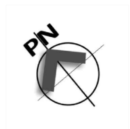
LOKALIZACJA W BUDYNKU